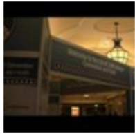
Convencion LULAC en Las Vegas www.tvkinc.com